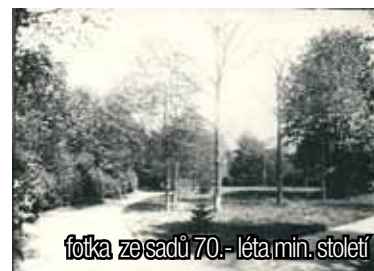
fotka ze sadů 70.- léta min. století