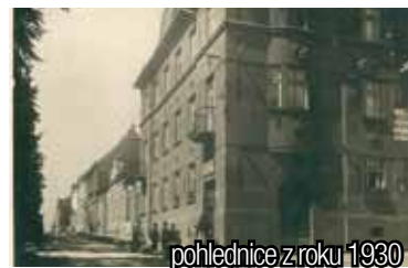
pohlednice z roku 1930