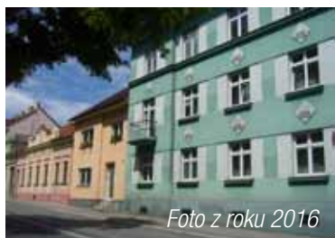
Foto z roku 2016