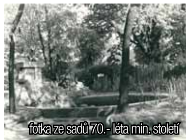
fotka ze sadů 70.- léta min. století