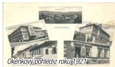
Okénkový pohled z roku 1921

Dnes se vydáme ulicí Husova, vedoucí kolem městského parku jako výpadovka