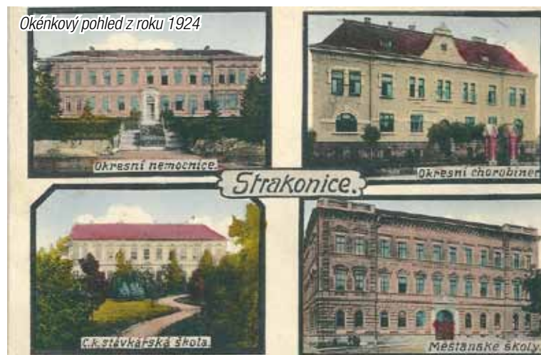
Okénkový pohled z roku 1924