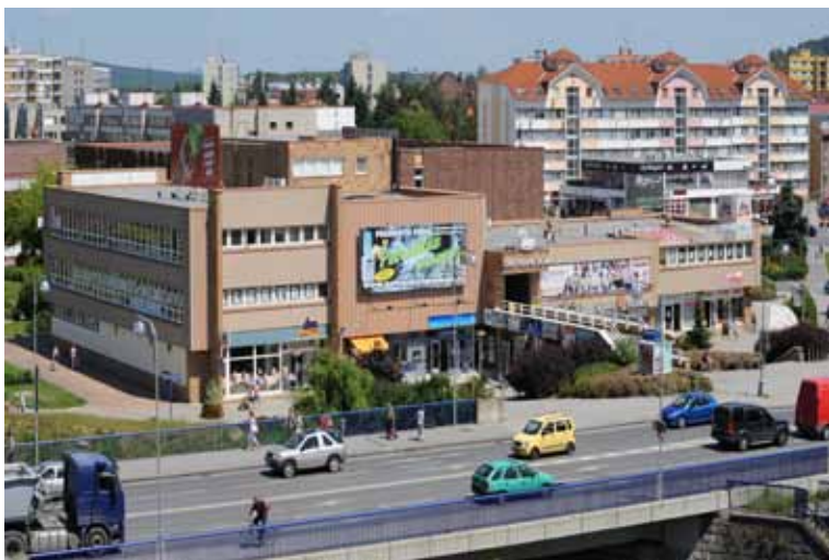
pokračování z titulní strany

uspořádání, usilovné práce a kompromisů. Tuto práci si můžeme pro přehlednost rozdělit na čtyři základní části.