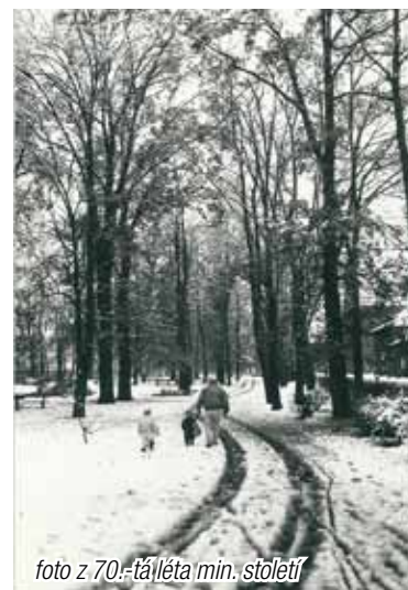
foto z 70. - tá léta min. století