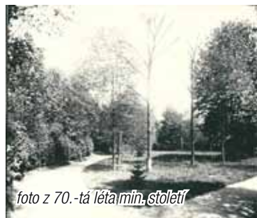
foto z 70. - tá léta min. století