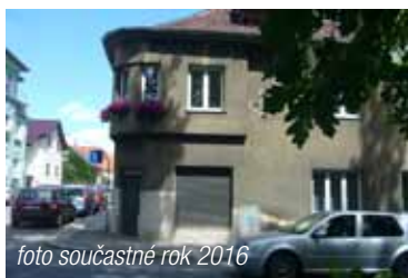
foto současné rok 2016

stejně jako celá ulice ustoupit a došlo k jejich stržení. Zachovaly se jen nepatrné zbytky hradeb a bašta v zahradě za novými domy Čelakovského ulice.