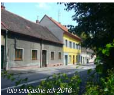
foto současné rok 2016

na Horažďovice. Nejprve se zastavíme u městských sadů vedoucích od silnice Radomyšlské, přes Sokolovskou a konče Havlíčkovou. Vznikali za městskými hradbami a vodním příkopem. Hradby se stali časem součástí zahrad domů v ulici Čelakovské a postupně chátaraly a při vzniku nové zástavby musely