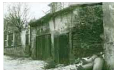
domy kolem roku 1960