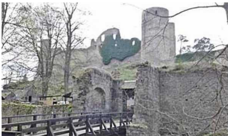
pokračování z titulní strany

Ochranu domu a chlévů zajišťovaly drny, písek nebo plevy, zelené ratolesti a svěčené kočičky, také kresby kruhů nebo křížků na vratech. Magický kruh chránil před zlými silami ještě dříve, než si ho lidé zvykli spojovat s představou čarodějnic.