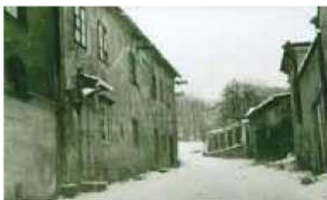
domy kolem roku 1960