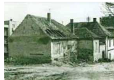
domy kolem roku 1960