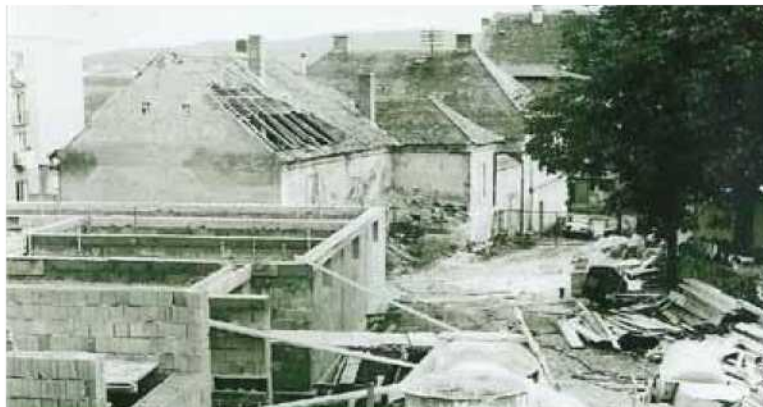
demolice r. 1971