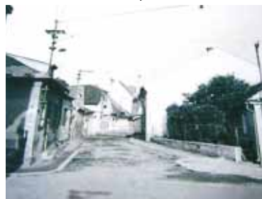
Začátek Čelakovské od ulice Na stráži