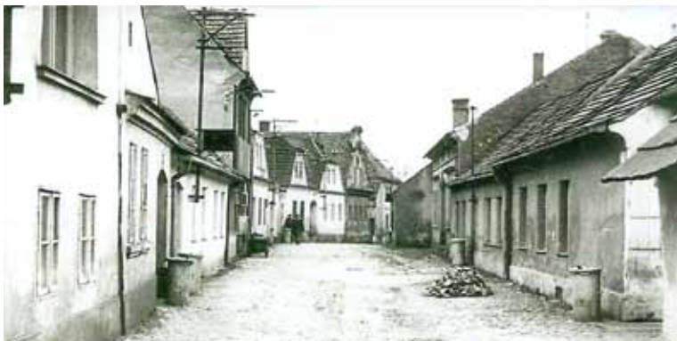
Dům U Raka