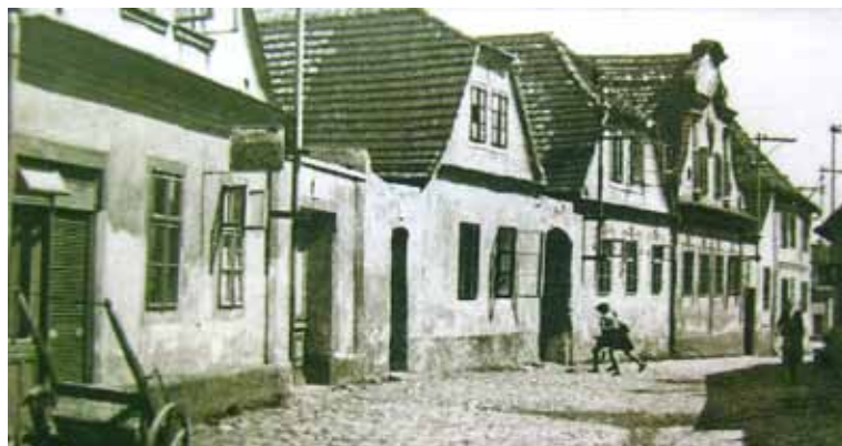
Čelakovská s domem U Raka v pozadí